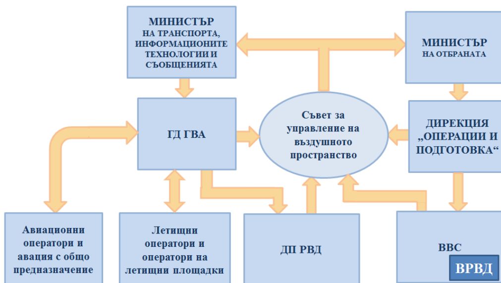
Фигура 4. Гражданско-военна координация

Съветът за управление на въздушното пространство е стратегическо ниво на единната система за гражданско и военно управление на въздушното пространство в Република България. В него участват представители на заинтересованите страни от Министерството на транспорта, информационните технологии и съобщенията (МТИТС), Министерството на отбраната (МО), ГД ГВА, служители на Българската армия, Главното командване на ВВС, Държавно предприятие „Ръководство на въздушното движение“ (ДП РВД) и военните подразделения за УВД. Той действа като изпълнителен междуведомствен орган на МТИТС и МО.