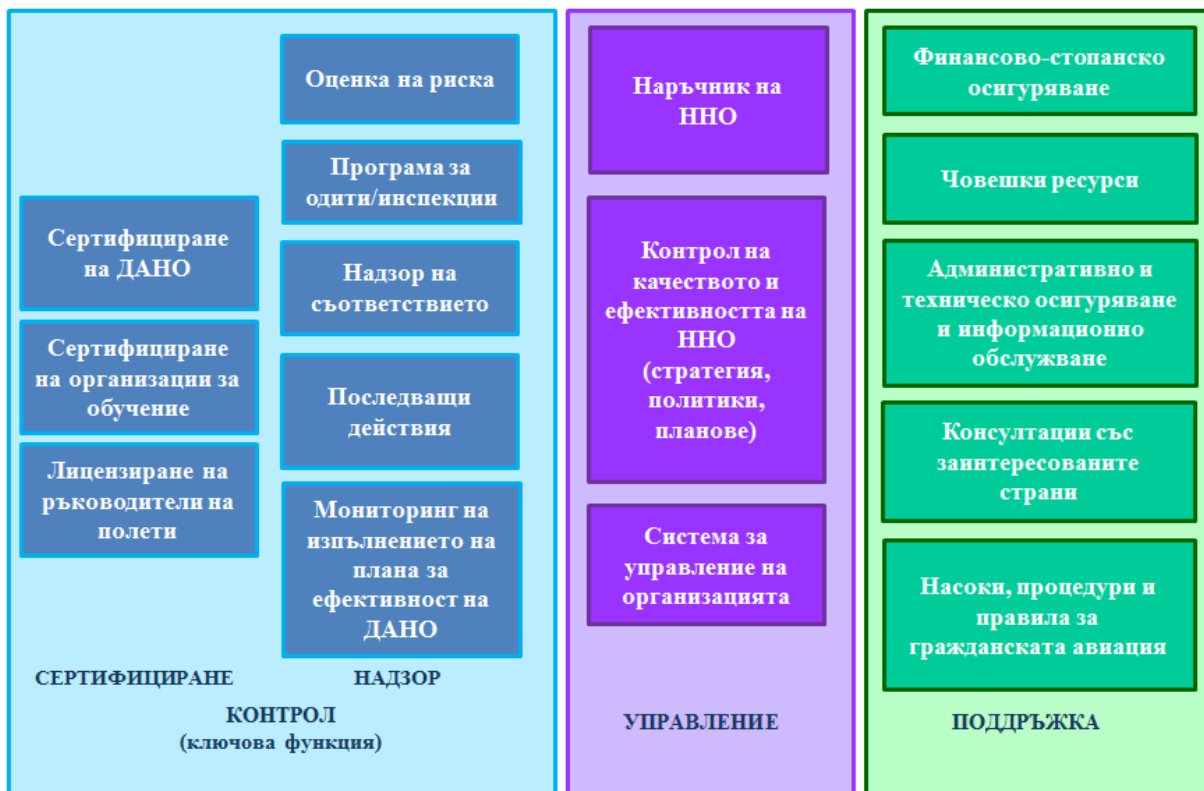
Фигура 3. Функции на ННО

Основните задачи, възложени на ГД ГВА/ННО в рамките на законодателството за единното европейско небе са, както следва: